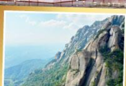
เขาหลิงอาน