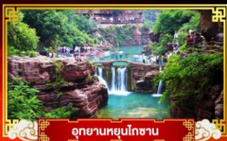
อุทยานหยุนโกซาน

“ซีอาน” อารยธรรมโบราณอายุสามพันปี มหาสุสานของจักรพรรดิฉิน ..จีนชื่องัด