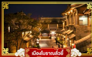
เมืองโบราณลั่วหยี่