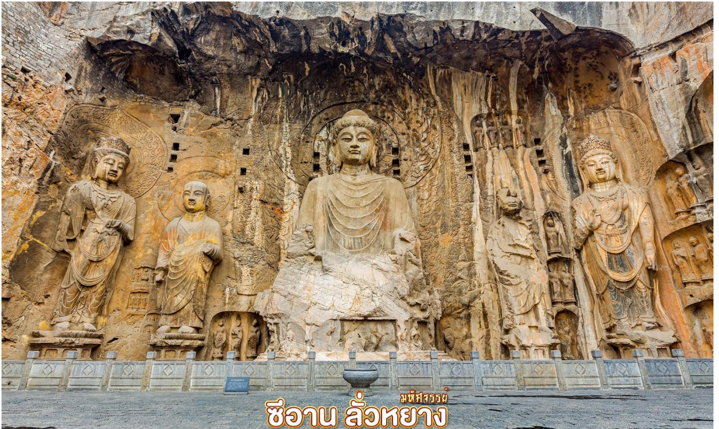
มณฑลยูนนาน ซีอาน ลั่วหยาง

‘พระโพธิสัตว์ไวโรจนะ’ มีความสูงถึง 17.14 เมตร ความโดดเด่นอยู่ที่ดวงตาที่ดูเหมือนว่า ไม่ว่าจะยืนอยู่ตรงไหนดวงตานั้นก็ยังคงมองเห็นอยู่ ซึ่งพระประธานองค์นี้เชื่อว่าแกะสลักเป็นรูปพระพักตร์ของ ‘พระนางบูเช็กเทียน’ จักรพรรดินี (ฮ่องเต้หญิง) องค์แรกและองค์เดียวที่ได้รับการบันทึกไว้ในประวัติศาสตร์จีน