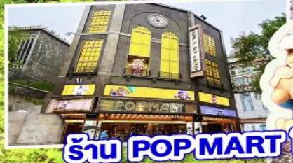
ร้าน POP MART ใหญ่ที่สุดในไต้หวัน