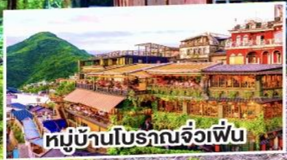
หมู่บ้านโบราณจิวเฟิ่น