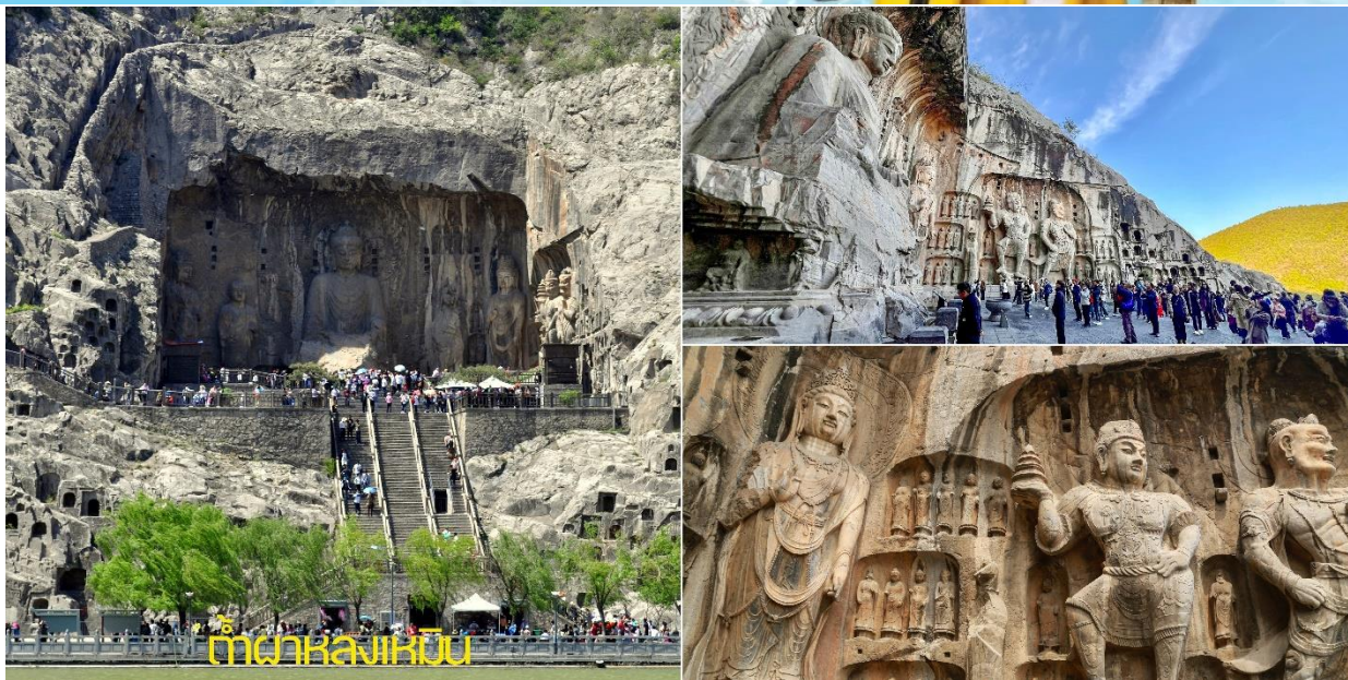
ถ้ำผาลงเหมิน

จากนั้นนำท่านเดินทางไปเมืองหัวซาน เป็นหนึ่งในสถานที่ท่องเที่ยวชื่อดังของประเทศจีน ตั้งอยู่ในเมืองหัวอิน (หัวหยิน) มณฑลส่านซี ทางตะวันตกเฉียงเหนือของจีน