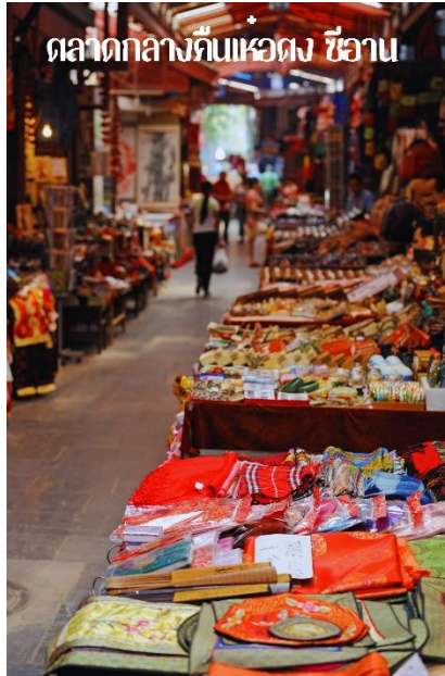
ตลาดกลางกันแห่ตง ซื่อาน