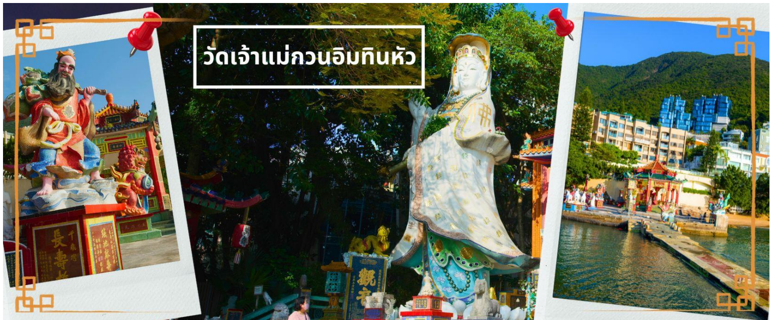
วัดเจ้าแม่กวนอิมทินหัว