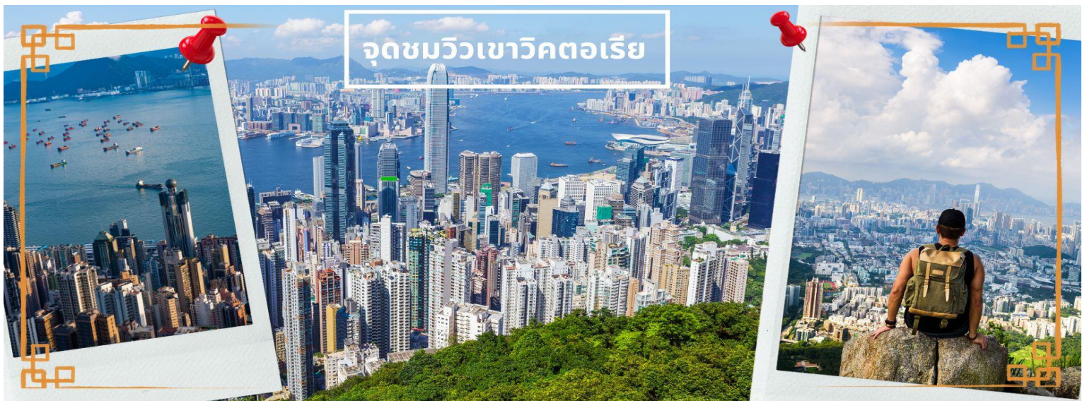
จุดชมวิวยิวเวาวิคตอเรีย

นำท่านขึ้นสู่ จุดชมวิวยิวเวาวิคตอเรีย โดยรถโค้ช ตี๋มด้ากับบรรยากาศของฮ่องกงแบบพาโนรามา 360 องศา ให้ท่านถ่ายรูปตามอัธยาศัย ตื่นตาตื่นใจกับทัศนียภาพของเกาะฮ่องกงและฝั่งเกาลูน ซึ่งทุกท่านจะได้เห็นวิวของฝั่งฮ่องกงตลอดการเดินทาง และวิวตึกสูง ตลอดจนอาคารต่างๆ ที่สร้างตามหลักฮวงจุ้ย ถือเป็นจุดชมความงามของเมืองที่ได้รับความนิยมกันมาก สามารถมองเห็นภาพพาโนรามาของเมืองฮ่องกงได้และมองเห็นวิวเมืองด้านล่างได้เกือบทั่วทั้งหมด ไม่เพียงแค่อีกต่าง ๆ รวมถึงอ่าว และสันเขาไกล ๆ ของเกาะอีกด้วย