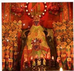
เจ้าแม่กวนอิมวัดสองฮ่า