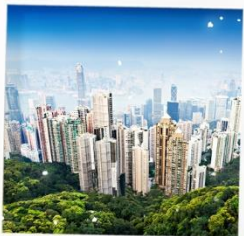
จุดชมวิวยาวิวคตอเรีย