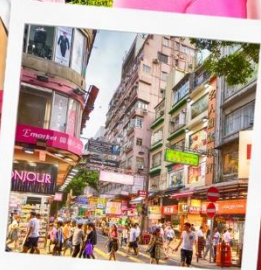
ช้อปปิ้งย่านมงก๊ก