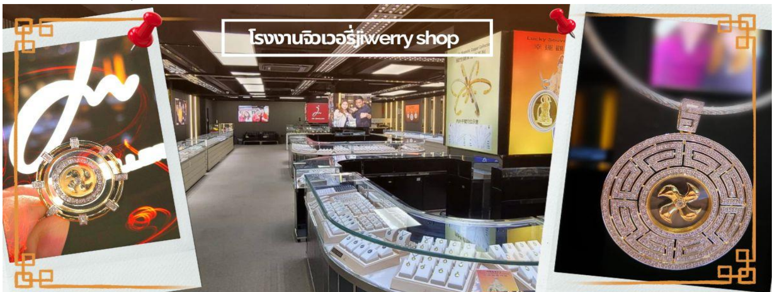
โรงงานจิวเวอรี่jewerry shop

จากนั้นนำท่านชม โรงงานจิวเวอรี่ ซึ่งเป็นโรงงานที่มีชื่อเสียงที่สุดของฮ่องกงในเรื่องการออกแบบเครื่องประดับ อาทิเช่น จี้ และแหวนกำหั้น ที่สวยงามโดดเด่นไม่เหมือนใคร ซึ่งถือกำเนิดขึ้นที่นี่และมีชื่อเสียงที่สุดใช้เป็นเครื่องประดับติดตัว และเสริมดวงชะตา สินค้าทุกชิ้นมีเอกสารรับประกันคุณภาพเปลี่ยน ซ่อม ใต้ตลอดอายุการใช้งาน หากเกิดการชำรุดจากสินค้าไม่ใช่อุบัติเหตุ และนำท่านเลือกซื้อ เครื่องประดับที่ ร้านหยก ซึ่งคนจีนนั้นถือว่าหยกเป็นหิน ที่เป็นตัวแทนของความสวยงามและความบริสุทธิ์ มีความเชื่อว่าหยกมงคล ถ้าพกติดตัวไว้จะอายุยืน และสุขภาพดี