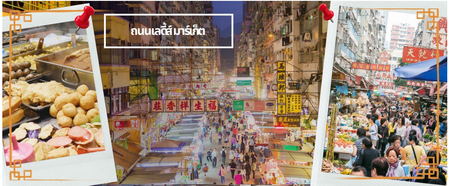
ถนนเลดี้ มาร์เก็ต

☉ อิสระอาหารเย็นตามอัธยาศัย **ไม่รวมอยู่ในโปรแกรม** เพื่อความสะดวกในการช้อปปิ้ง