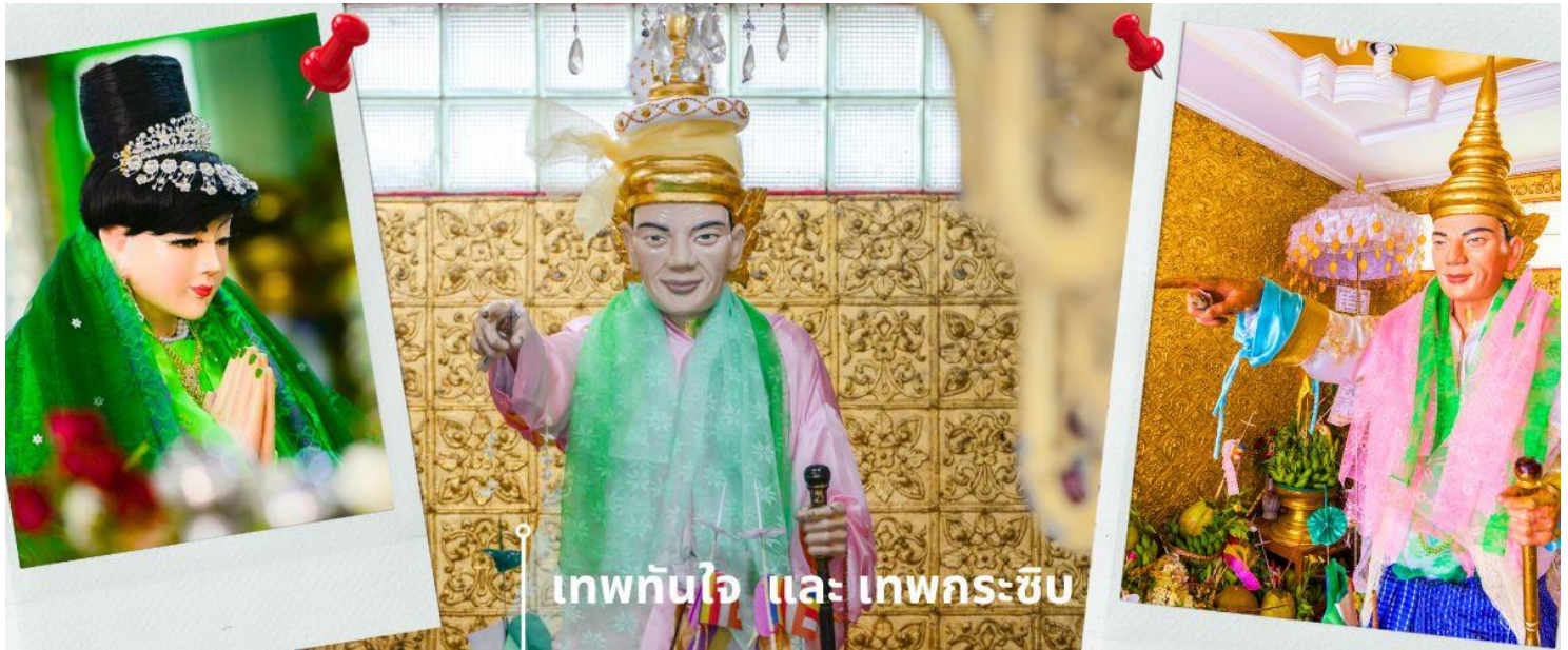
เทพทันใจ และ เทพกระซิบ

“อะมาดอว์เมี่ยะ” ตามตำนานกล่าวว่า นางเป็นธิดาของพญานาค ที่เกิดศรัทธาในพุทธศาสนาอย่างแรงกล้า รักษาศีล ไม่ยอมกินเนื้อสัตว์จนเมื่อสิ้นชีวิตไปกลายเป็นนัต ซึ่งชาวพม่าเคารพกราบไหว้กันมานานแล้ว การขอพรเทพกระซิบ ต้องเข้าไปกระซิบเบาๆ ห้ามคนอื่นได้ยิน การบูชาเทพกระซิบ บูชาด้วยน้ำนม ข้าวตอก ดอกไม้ และผลไม้