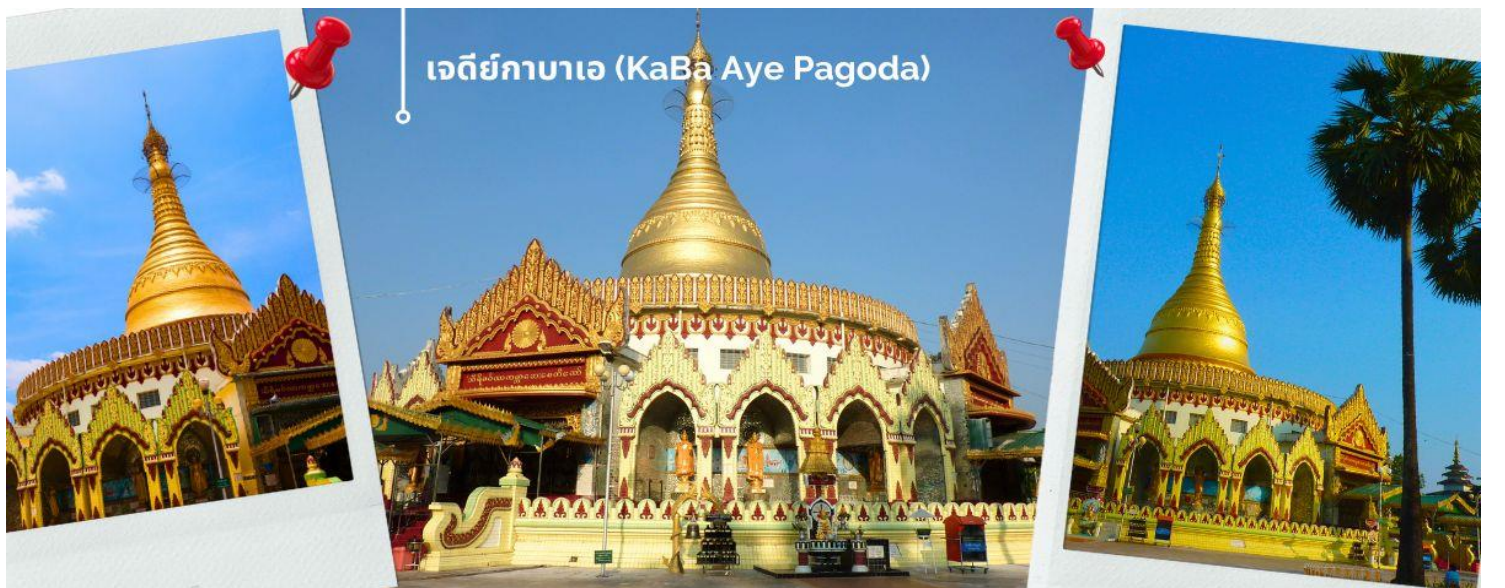
เจดีย์กาบาเอ (KaBa Aye Pagoda)

จากนั้นนำท่าน เดินทางไปยัง เจดีย์กาบาเอ (KaBa Aye Pagoda) เพื่อร่วมพิธี เทินพระธาตุ พิธีอันศักดิ์สิทธิ์ เป็นเจดีย์ทรงกลมครึ่ง ซึ่งมีการเข้าทั้งหมดห้าด้านด้วยกัน นายอู่นายกคนแรกของพม่า ได้สร้างขึ้นเพื่อใช้เป็นสถานที่ชำระพระไตรปิฎก สูง 34 เมตร สร้างขึ้นเมื่อปี 1952 เพื่อทำการสังคายนา พระไตรปิฎกครั้งที่ 6 เป็นเจดีย์ที่มีความสวยงามและแปลกตา ภายในบรรจุพระอัฐิธาตุของพระอัครสาวกแห่งองค์พระสัมมาสัมพุทธเจ้า คือพระโมคคัลลานะ และพระสารีบุตร จะมีทางเข้าทั้งหมดห้าด้าน ทุกด้านมีพระพุทธรูปประดิษฐานอยู่บนฐานทักษิณ มีพระพุทธรูปหุ้มด้วยทองคำองค์เล็กๆอีก 28 องค์ แทนอดีตสาวกของพระพุทธเจ้าทั้ง 28 องค์ ที่อุบัติขึ้นในโลกนี้ ส่วนพระพุทธรูปองค์