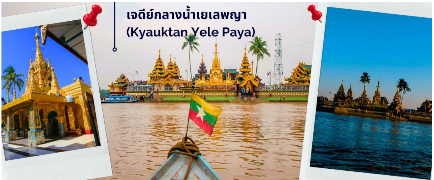
เจดีย์กลางน้ำเยเลพญา (Kyauktan Yele Paya)

นำท่านออกเดินทางสู่ เมืองสิริเรียม (ใช้เวลาเดินทางประมาณ 45 นาที) ตาน-ลยิน หรือ เซอ้ง ในอดีตไทยเรียก เสี่ยง มีชื่อเดิมที่เป็นที่รู้จักกันโดยทั่วไปว่า สิริเรียม เป็นเมืองท่าสำคัญของภาคย่างกุ้ง ประเทศพม่า ตั้งอยู่ปากแม่น้ำอิรวดี อดีตเป็นเมืองท่าขึ้นนอกของพะโคหรือหงสาวดี เคยเป็นที่มั่นของทหารโปรตุเกสที่ช่วยเหลือชาวอมอญทำสงครามกับพม่า ตั้งแต่คริสต์ศตวรรษที่ 16 เจดีย์กลางน้ำเยเลพญา (Kyauktan Yele Paya) เจดีย์นี้สร้างขึ้นบนเกาะกลางน้ำ เรียกอีกชื่อหนึ่งว่า “เจดีย์กลางน้ำ” เป็นที่สักการะของชาวสิริเรียม ที่บริเวณท่าเทียบเรือบนเกาะ พร้อมนมัสการพระพุทธรูปทรงเครื่องจักรพรรดิเก่าแก่ ที่ประดิษฐานบนบัลลังก์ไม้แกะสลักปิดทองคำเปลว ที่งดงามมีอายุนับพันปี ซึ่งเป็นที่สักการบูชาของชาวพม่าและชาวต่างชาติ