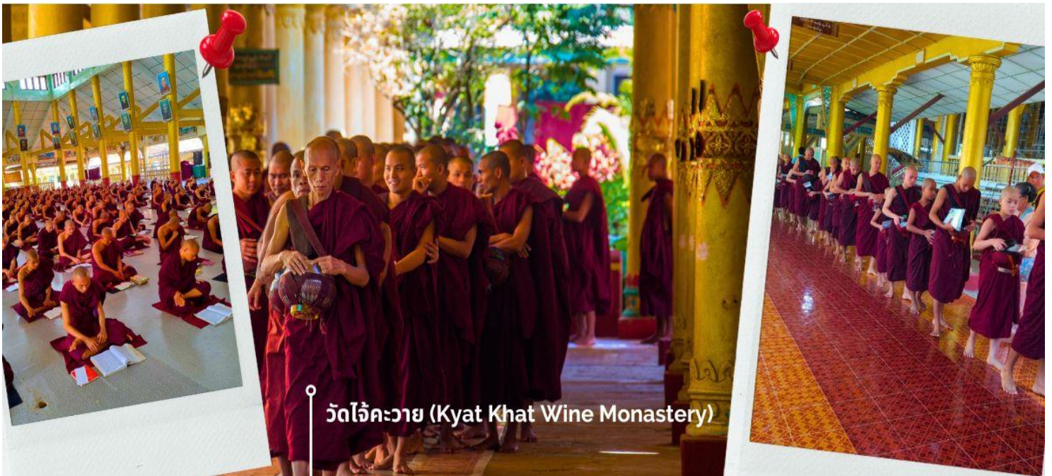
วัดไจ้คะวาย (Kyat Khat Wine Monastery)

นำท่านเดินทางลงจากพระธาตุนรินทร์แขวน โดยใช้เส้นทางเดิม เพื่อมุ่งหน้าสู่เมืองหงสาวดี (ใช้เวลาเดินทางประมาณ 1 ชั่วโมง 30 นาที) เชิญร่วมทำบุญตักบาตรพระสงฆ์ ณ วัดไจ้คะวาย เมืองหงสาวดี มีพระสงฆ์กว่า 1000 รูป เป็นโรงเรียนสอนพระพุทธศาสนา นักธรรมชั้นตรี โท และ เอก เพื่อศึกษาพระไตรปิฎกเป็นจำนวนมาก ในช่วงสายของทุกวัน พระสงฆ์และเณร จะเดินออกมาบิณฑบาตเพื่อเตรียมฉันเพล โดยวัดแห่งนี้ ได้รับการสนับสนุนจากชาวพุทธในพม่าเองและ นักท่องเที่ยวที่เดินทางมาที่วัด เพื่อทำการถวายเงินปัจจัย หรือข้าวสาร รวมไปถึง อุปกรณ์การเรียนและเครื่องเขียนต่างๆ เพื่อใช้ในการ ศึกษาธรรมะของพระสงฆ์และเณรในวัดไจ้คะวายแห่งนี้