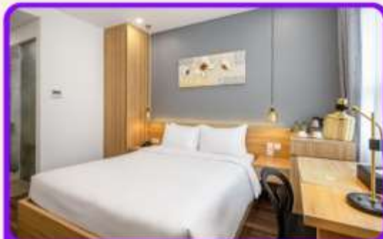
พักเมืองดานัง 4 ดาว 2 คืน