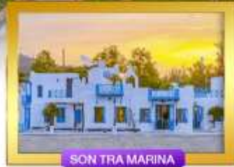
SON TRA MARINA