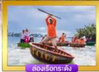
ส่องเรือกระดังง์