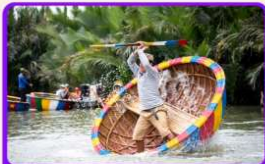
พิเศษ !!! นั่งเรือกระด้ง UNSEEN เวียดนาม