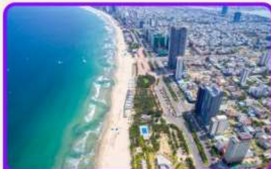
เช็คอิน ชายหาดหมีเคว เป็นชายหาดที่สวยงามที่สุดในเมืองดานัง