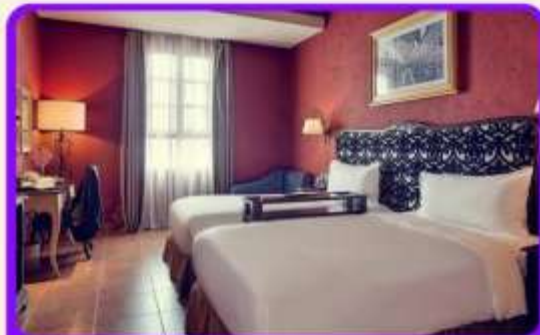
พักบนบานาฮิลล์ 1 คืน