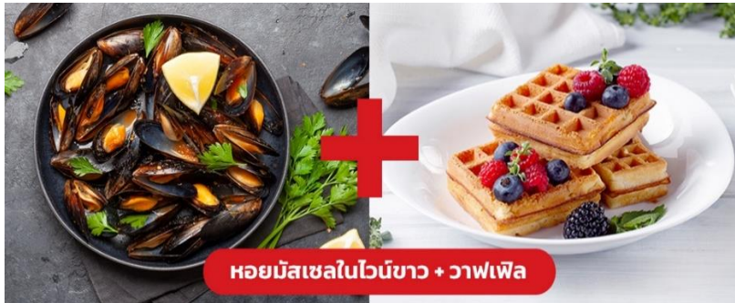
หอยมัสเซลในไวน์ขาว + วาฟเฟิล

เย็น ๑๑ รับประทานอาหารเย็น (มื้อที่10) เมนูพิเศษ!! หอยมัสเซล + วาฟเฟิล (Mussel in White wine + Waffle)