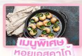
เมนูพิเศษ หอยเอสคาโท

เยอรมัน เนเธอร์แลนด์ เบลเยียม ฝรั่งเศส Keukenhof