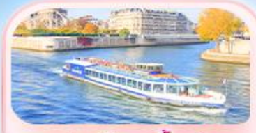
ล่องเรือแม่น้ำเซน