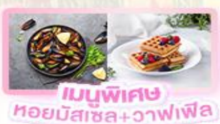
เมนูพิเศษ หอยมัสเซล+จาวาเฟิล