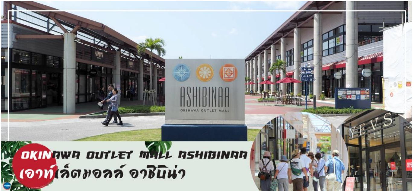
OKINAWA OUTLET MALL ASHIBINAA เอาท์เล็ตมอลล์ อาชิบิโนะ

จากนั้นนำท่านสู่ เอาท์เล็ตมอลล์ อาชิบิโนะ (Okinawa Outlet Mall Ashibinaa) (ใช้เวลาเดินทางประมาณ 30 นาที) เอาท์เล็ตแห่งแรกในโอกินาวะ รวบรวมร้านค้าชั้นนำกว่า 100 ร้าน ทั้งเสื้อผ้าแฟชั่น สินค้าแบรนด์เนม นาฬิกา ข้าวของเครื่องใช้ ของเล่น ทุกร้านจัดเต็มทั้งสินค้านำเข้าและรุ่นใหม่ ลดราคากระหน่ำกว่า 30-80% ให้ได้เดินช้อปปิ้งท้ายทวีปกันอย่างจุใจ ภายใต้บรรยากาศสบายๆ สไตล์รีสอร์ทริมทะเล หากช้อปปิ้งเหนื่อยสามารถขึ้นไปทานอาหารที่ชั้น 2 มีอีกหลายร้านที่คอยให้บริการ