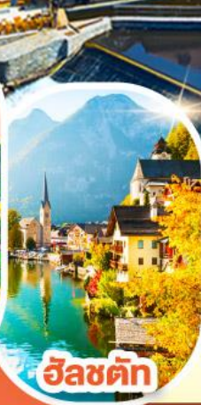
ฮัลลัตซ์