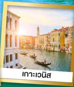
เกาะเวนิส