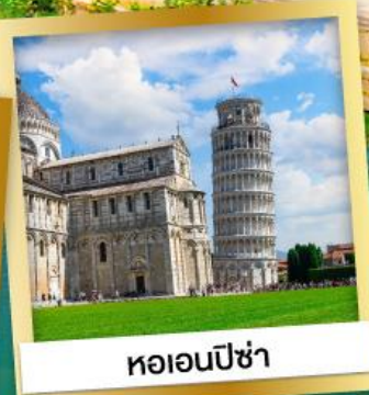
หออนปิซ่า