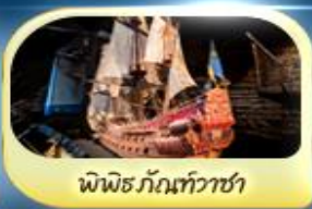
พิพิธภัณฑ์ทิวาชา