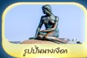
รูปปั้นนางเงือก