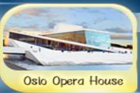
Oslo Opera House