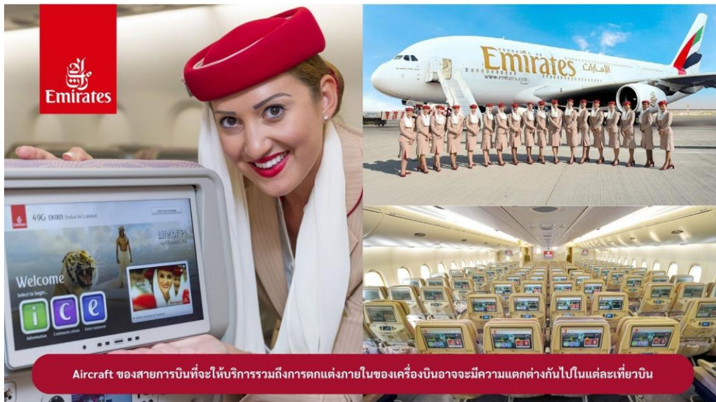
Aircraft ของสายการบินที่จะให้บริการรวมถึงการตกแต่งภายในของเครื่องบินอาจมีความแตกต่างกันไปในแต่ละเที่ยวบิน

22.30 น. !!!! ขณะเดินทางพร้อมกัน ณ สนามบินสุวรรณภูมิ อาคารผู้โดยสารขาออกระหว่างประเทศ ชั้น 4 ประตู 9 แถว T สายการบินเอมิเรตส์ แอร์ไลน์ (EK) เจ้าหน้าที่ให้การต้อนรับและอำนวยความสะดวก