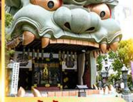
ศาลเจ้านิมบะยาซากะ