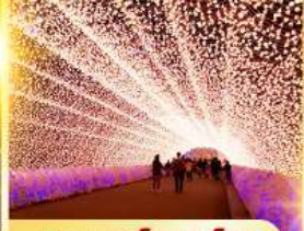
นาบานะโนะซาโตะ