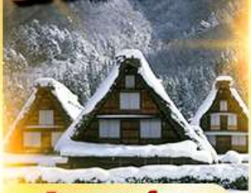
ชิราคาวาโกะ