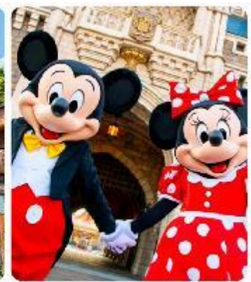
โตเกียวดิสนีย์แลนด์

แนะนำที่เที่ยว อิสระด้วยตัวเองเต็มวัน ! เลือกซื้อทัวร์เสริมอิสระดิสนีย์แลนด์ (ไม่มีหัวหน้าทัวร์และไม่มีไกด์นำเที่ยว) เอาใจแฟนพันธุ์แท้ของดิสนีย์ กับ สวนสนุกโตเกียวดิสนีย์แลนด์ ที่เต็มไปด้วยการผจญภัย ความสนุกสนานในโลกแฟนตาซีเมื่อเดินทางเข้าสู่ สวนสนุกโตเกียวดิสนีย์แลนด์ จะพบกับธีมพาร์คที่ แบ่งออกเป็น หลากหลาย เช่น Adventureland ที่เต็มไปด้วยการผจญภัยในป่าและน้ำตก, Fantasyland ดินแดนของตัวละครดิสนีย์ที่คุณหลงใหล, และ Tomorrowland ที่ จะพาคุณไปสำรวจอนาคตที่เต็มไปด้วยนวัตกรรม และเปิดประสบการณ์ใหม่ที่ Tokyo Disney Sea ที่จะพาคุณไปผจญภัยยังโลกทะเลและการผจญภัยทางน้ำ นอกจากนี้เรายังเพลิดเพลินกับร้านอาหารและคาเฟ่รวมไปถึงของฝากจากดิสนีย์อีกมาย (ค่าทัวร์ยังไม่รวมบัตรค่าเข้า)