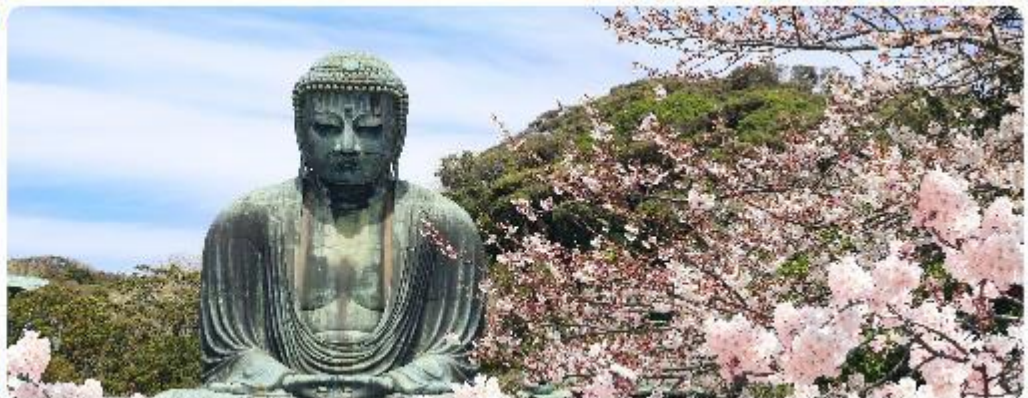
พระใหญ่ไดบุทสึ วัดโคโตคุอิน

จุดเด่นแห่งเมืองนี้คือ พระพุทธรูปองค์ใหญ่ไดบุทสึ (Daibutsu) หนึ่งในสัญลักษณ์ที่โดดเด่นที่สุดของ Kamakura พระพุทธรูปบรอนซ์ขนาดมหึมาที่วัดโคโตคุอิน (Kotoku-in) ที่มีความสูง 13.35 เมตร หนึ่งใน