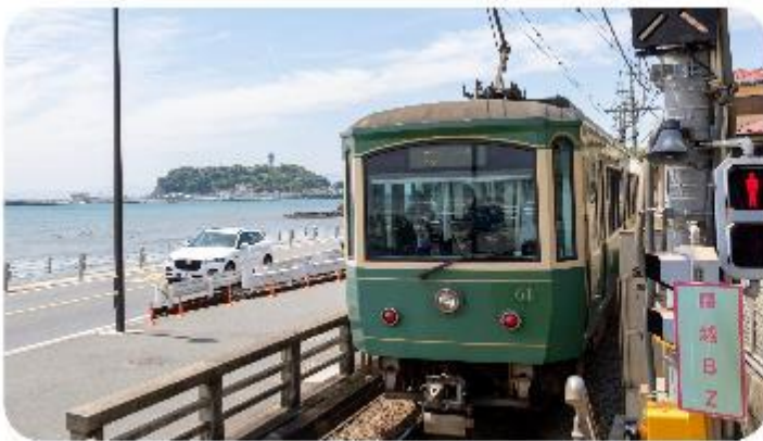
เมืองคามาคุระ

เทศกาลซากุระบาน เริ่ม ~ 24 มี.ค. - พัก ~ 31 มี.ค. เมืองคามาคุระ | พระใหญ่ไดบุทสึ แห่งเมืองคามาคุระ เกาะเอโนะชิมะ | Gotemba Premium Outlets