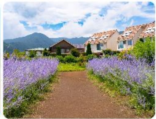
สวนโออิชิ ปาร์ค

สวนดอกไม้โออิชิ พาร์ค (Oishi Park) มหัศจรรย์แห่งวิวกูเขาไฟฟูจิ หนึ่งในจุดชมวิวกูภูเขาไฟฟูจิที่สวยงามที่สุดอีกจุดหนึ่ง ที่จะเติมเต็มความสงบและความงดงามของธรรมชาติในญี่ปุ่นเมื่อไปเยือน คือสถานที่ที่ไม่ควรพลาด สวนดอกไม้โออิชิ พาร์ค (Oishi Park) แห่งนี้ไม่ได้เป็นเพียงสถานที่ที่มีดอกไม้สวยงามให้เราได้ชื่นชมแล้ว จุดเด่นของสวนนี้คือวิวกูเขาฟูจิที่อยู่เบื้องหลังสวนดอกไม้สีแสนสดใส ที่บานสะพรั่งในทุกฤดูกาล และยังเป็นมุมที่ให้เราได้สัมผัสกับวิวกูเขาฟูจิได้อย่างใกล้ชิด จากนั้นนำพาทุกท่านสู่..