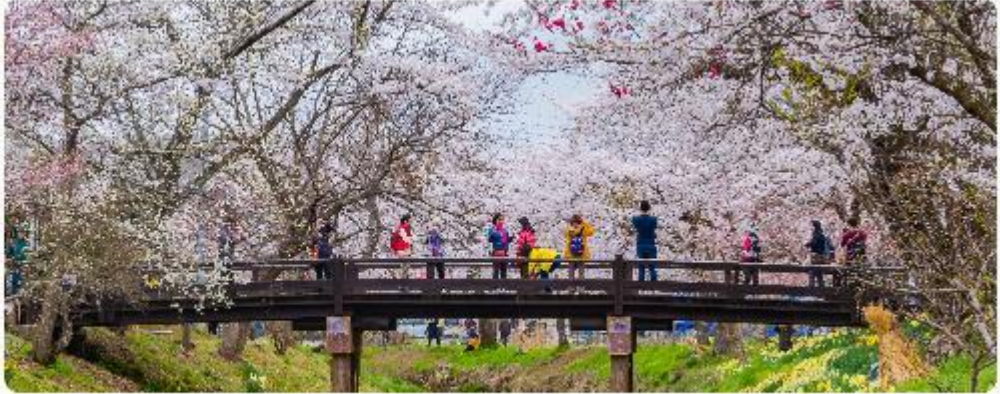
หมู่บ้านน้ำใสโอชิโนะ ฮักโก

โอชิโนะ ฮักโก หรือ ที่รู้จักกันในชื่อ หมู่บ้านน้ำใส ความงามแห่งธรรมชาติและวัฒนธรรมที่ซ่อนอยู่ใต้เงาภูเขาไฟฟูจิโอชิโนะ ฮักโก ตั้งอยู่ในหมู่บ้านโอชิโนะ จังหวัดยามานาชิ ประเทศญี่ปุ่น เป็นแหล่งน้ำธรรมชาติที่มีชื่อเสียง ประกอบด้วยบ่อน้ำใสสะอาดทั้งแปดแห่ง ซึ่งน้ำในบ่อเหล่านี้เกิดจากการละลายของหิมะและน้ำแข็งจากภูเขาไฟฟูจิ น้ำที่ไหลลงมานั้นได้ถูกกรองผ่านชั้นหินภูเขาไฟเป็นเวลาหลายปี จนทำให้น้ำในบ่อมีความบริสุทธิ์และใสจนเห็นถึงก้นบ่อ ไม่เพียงแต่ความงามของธรรมชาติที่ทำให้โอชิโนะ ฮักโกเป็นที่รู้จัก แต่ยังมีมุมมองเชื่อมโยงกับวัฒนธรรมและประวัติศาสตร์ท้องถิ่นอย่างลึกซึ้ง หมู่บ้านนี้เป็นสถานที่ที่เราสามารถสัมผัสกับบรรยากาศที่เงียบสงบและงดงามของธรรมชาติ พร้อมกับเรียนรู้เรื่องราวและวิถีชีวิตดั้งเดิม สัมผัสวัฒนธรรมญี่ปุ่นที่แท้จริงจากนั้น..นำพาทุกท่านสู่ DUTY FREE ที่ให้ทุกท่านได้เลือกซื้อหรือจะเลือกซื้อเป็นของฝากได้ตามอัธยาศัย โดยสินค้าที่แนะนำ เช่น วิตามินบำรุงสุขภาพ สรรพคุณหลากหลายชนิด และสินค้าชื่อดังของญี่ปุ่น โฟมล้างหน้าถ่านหินภูเขาไฟ และ เครื่องสำอางค์ Special Set และอื่นๆ อีกมากมาย