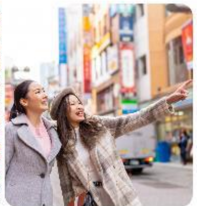
ช้อปปิ้งใจกลางกรุงโตเกียว

แนะนำที่เที่ยว อิสระด้วยตัวเอง - อิสระช้อปปิ้งใจกลางเมืองโตเกียว