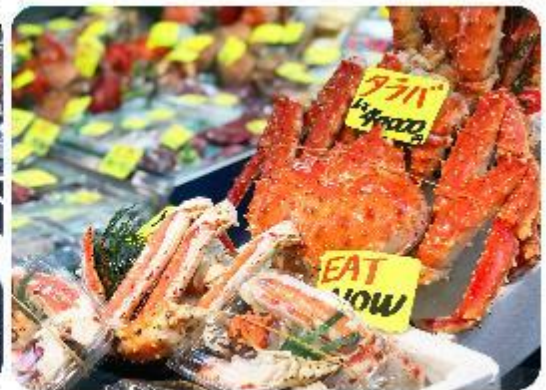
ตลาดปลาซึกิจิ

แนะนำที่เที่ยว อิสระด้วยตัวเอง - ตลาดปลาซึกิจิ Tsukiji Outer Market ตลาดปลาซึกิจิมีชื่อเสียงของญี่ปุ่น และยังเป็นหนึ่งในตลาดปลาที่ใหญ่ที่สุดในโลกด้วยตะ ตั้งอยู่ในโตเกียว ตลาดแห่งนี้มีการซื้อขายอาหารทะเลมากกว่า 2,000 ตันต่อวัน โดยโซนภายในตลาดนั้นจะแบ่งออกเป็น 2 ส่วน ก็คือ ส่วนด้านนอก ที่มีร้านค้าปลีกและร้านอาหารอยู่เรียงรายให้เราได้เลือกซื้ออาหารทะเลสดๆ รับประทานกัน