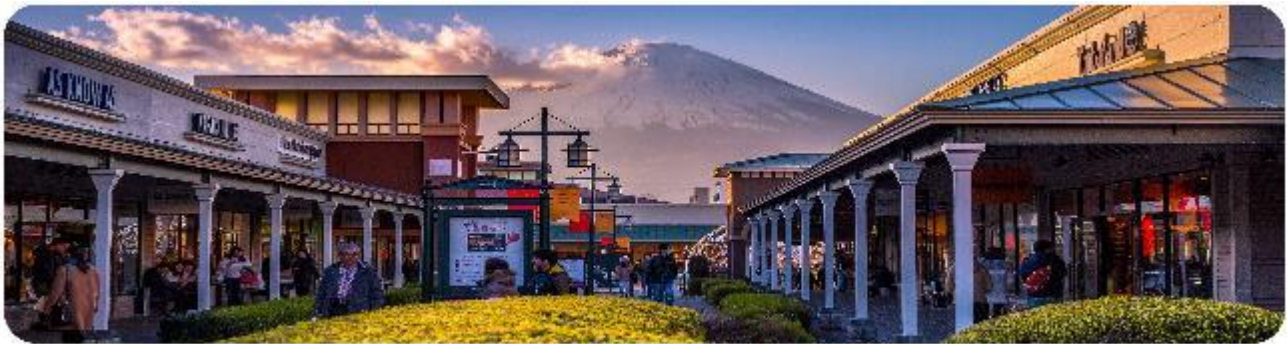
GOTEMBA PREMIUM OUTLETS

พระพุทธรูปที่ใหญ่ที่สุดในญี่ปุ่น ไฮไลท์ของที่นี่คือการได้ชมความงดงามที่ตัดกันระหว่างพระพุทธรูปโตบุทสึขนาดใหญ่และต้นซากุระ ซึ่งปลูกอยู่ทั้งด้านหน้าและด้านหลังของพระพุทธรูป ทำให้เหมาะอย่างยิ่งกับการเดินเล่นและชมซากุระในบริเวณวัด เป็นอีกหนึ่งสถานที่ที่ต้องมาเยือนสักครั้ง หนึ่งในจุดไฮไลท์ของเมืองคามาคุระคือ ไมโกลกันพาเยื่อน เกาะเอโนชิมะ (Enoshima) เป็นเกาะที่ตั้งอยู่ในจังหวัดคานากาว่า ประเทศญี่ปุ่น ซึ่งเป็นจุดหมายท่องเที่ยวยอดนิยมที่มีทิวทัศน์สวยงามและสถานที่น่าสนใจมากมาย ทั้งชายหาดสวย และวิวทะเลที่งดงาม ในวันที่ท้องฟ้าโปร่งใสเรายังสามารถมองเห็นวิวของภูเขาไฟฟูจิได้อีกด้วย ด้านบนยังมี ศาลเจ้าเอโนชิมะ ที่มีความสำคัญในด้านความโชคดี โดยเฉพาะในเรื่องความรัก นอกจากนี้ยังมี หอคอยประภาคารเอโนชิมะ ที่ให้ทัศนียภาพ 360 องศา ของเมืองคามาคุระได้อีกด้วย