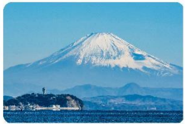
เกาะเอโนะชิมะ

เมืองคามาคุระ (Kamakura) เมืองน่ารักติดทะเล ตอบโจทย์ที่เที่ยวที่ผสมผสานระหว่างประวัติศาสตร์ ธรรมชาติ และความงามของทะเล บอกเลยใครมาต้องตกหลุมรักกับเมืองสุดชิล อย่าง คามาคุระ เมืองเล็กๆ ที่ตั้งอยู่ทางตอนใต้ของจังหวัดคานากาวะ ห่างจากโตเกียวเพียงแค่ 1 ชั่วโมง เท่านั้น แต่เต็มไปด้วยสถานที่ท่องเที่ยว ทิวทัศน์ธรรมชาติ และชายหาดที่งดงาม ที่นี้จะทำให้ทุกคนรู้สึกเหมือนได้ย้อนกลับไปสัมผัสประวัติศาสตร์ญี่ปุ่นในยุคซามูไร พร้อมทั้งได้ผ่อนคลายท่ามกลางบรรยากาศที่เงียบสงบและสดชื่น