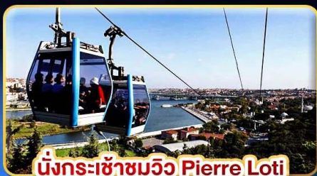
นั่งกระเช้าชมวิว Pierre Loti