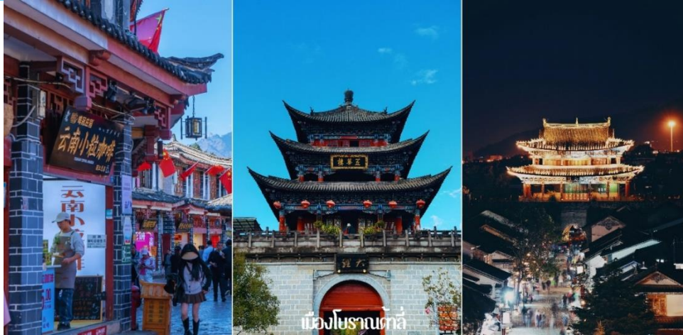
เมืองโบราณท่าลี่