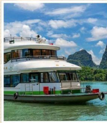
ล่องเรือแม่น้ำ หลีเจียง