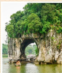
เขางวงช้าง