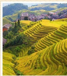
นาขั้นบันไดหลงจี้