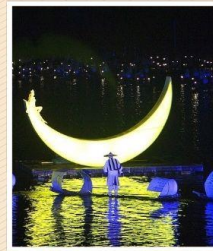
IMPRESSION LIU SANJIE