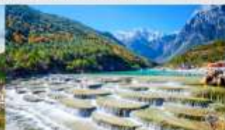
ทะเลสาบโป้สุ่ยเหอ