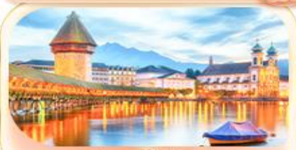
สะพานไมซ์าเปค