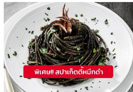
พิเศษ!! สปาเก็ตตี้หมึกดำ

Highlight! เมื่อเยือนเกาะเวนิส เมนูที่ขึ้นชื่อและหากได้มาต้องได้ลิ้มลอง สปาเก็ตตี้ผัดซอสหมึกดำที่คลุกเคล้ากับความหอมนุ่มนวลกับบรรยากาศ