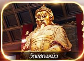
วัดแซกงหมิว