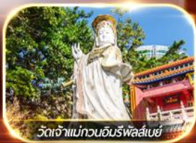
วัดเจ้าแม่กวนอิมริฟลัสเบย์