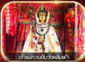
เจ้าแม่กวนอิมวัดหลินฟา