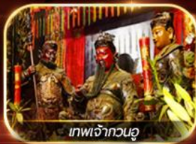
เทพเจ้ากวนอู

ไหว้พระ 6 วัดตั้ง ร่วมพิธีเปิดคลังทรัพย์ยืมเงิน เจ้าแม่กวนอิมฮ่องกง 1 ปีมีครั้งเดียว!!