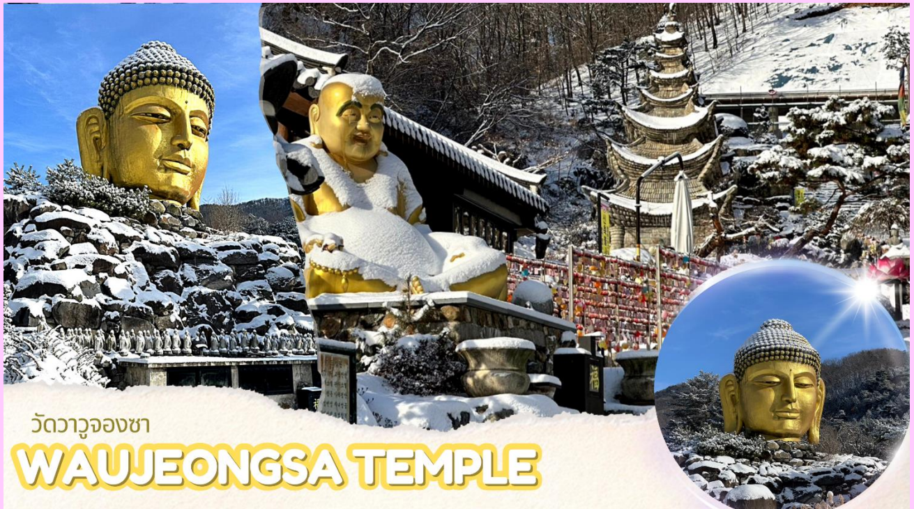
วัดวาจูองซา

โดยนักบวชแสต็อกเพื่อแสดงการตอบแทนความเมตตากรุณาของพระพุทธรูปเจ้าในการรวมประเทศเกาหลีเหนือและเกาหลีใต้