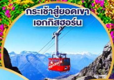
กระเช้าสู่ยอดเขา เอททิสฮอร์น

รถไฟกลาเซียร์เอ็กซ์เพรส รถไฟด่วนที่ช้าที่สุด