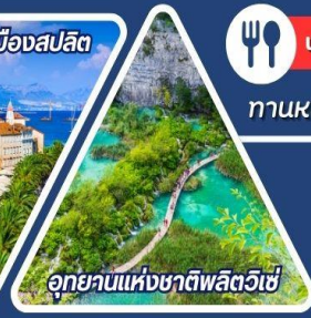
อุทยานแห่งชาติพลิตวิเซ่

ทานหอยนางรมสดจากทะเล พร้อมไวน์ท้องถิ่นรสเลิศ