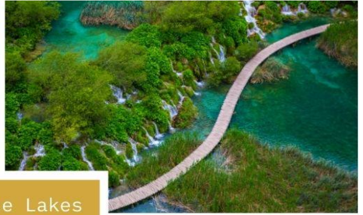
Plitvice Lakes National Park