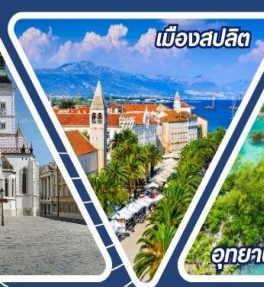
เมืองสปลิต