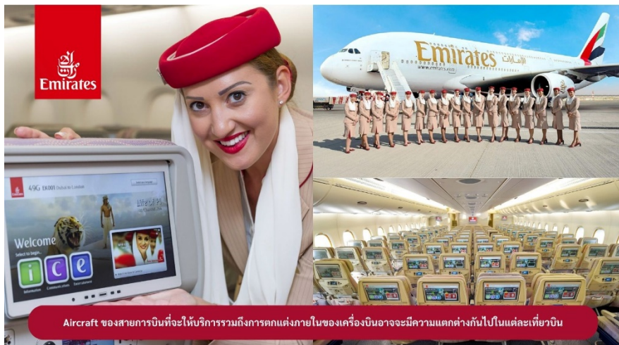
Aircraft ของสายการบินจะให้บริการรวมถึงการตกแต่งภายในของเครื่องบินอาจมีความแตกต่างกันไปในแต่ละเที่ยวบิน