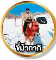
ขี่ม้าทากิ