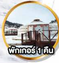
พักเกอร์ 1 คืน

กิจกรรมขี่อูฐ ณ มิมีโกบี (เอลาเซน ทาซาร์โค)