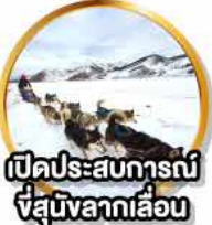
เปิดประสบการณ์ ขี่สุนัขลากเลื่อน