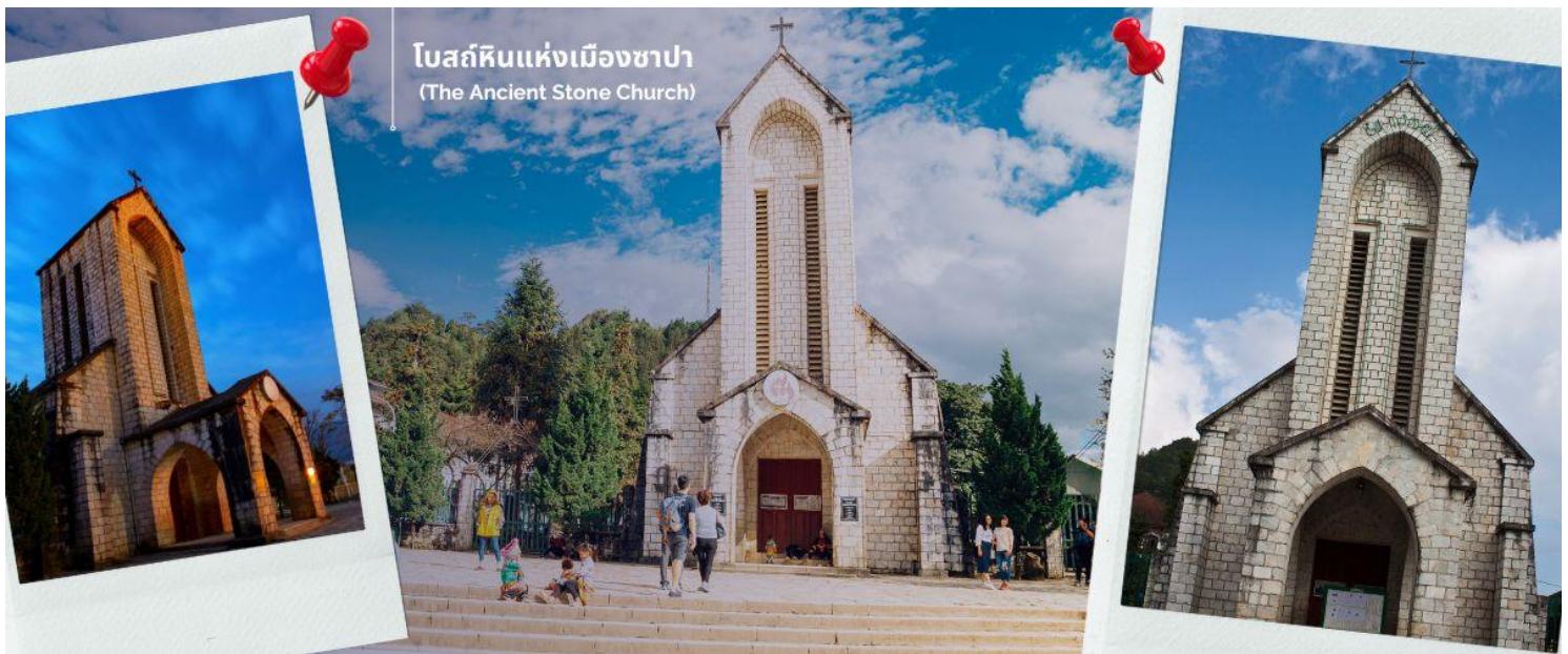
โบสถ์หินแห่งเมืองซาปา (The Ancient Stone Church)

จากนั้นพาทุกท่านชม โบสถ์หินแห่งเมืองซาปา (The Ancient Stone Church) อีกหนึ่งแลนด์มาร์กสำคัญของซาปาที่ต้องไปเช็คอิน เป็นโบสถ์หินที่สร้างขึ้นโดยชาวฝรั่งเศส เนื่องจากครั้งที่เป็นเมืองอาณานิคม มีชาวฝรั่งเศสมาอาศัยอยู่เมืองซาปาจำนวนมาก จึงเป็นโบสถ์สำคัญของเมืองนี้ที่ใช้ในการร่วมพิธีมิสซา ถึงแม้ว่าในตอนนีชาวฝรั่งเศสจะย้ายกลับไปแล้ว แต่โบสถ์แห่งนี้ก็ได้รับการอนุรักษ์เอาไว้เป็นอย่างดีและชาวซาปาที่เป็นคาทอลิกก็ยังคงใช้งานอยู่จนปัจจุบัน นำท่านช้อปปิ้งที่ ตลาดไนต์เมืองซาปา มีสินค้าให้ท่านเลือกช้อปปิ้งมากมาย ไม่ว่าจะเป็นสินค้าพื้นเมือง ของฝาก ขนมกระเป๋ารองเท้า ท่านสามารถช้อปปิ้งได้อย่างจุใจ