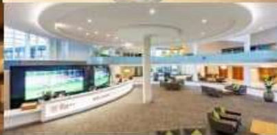
St. George's Park Hotel & Training Ground