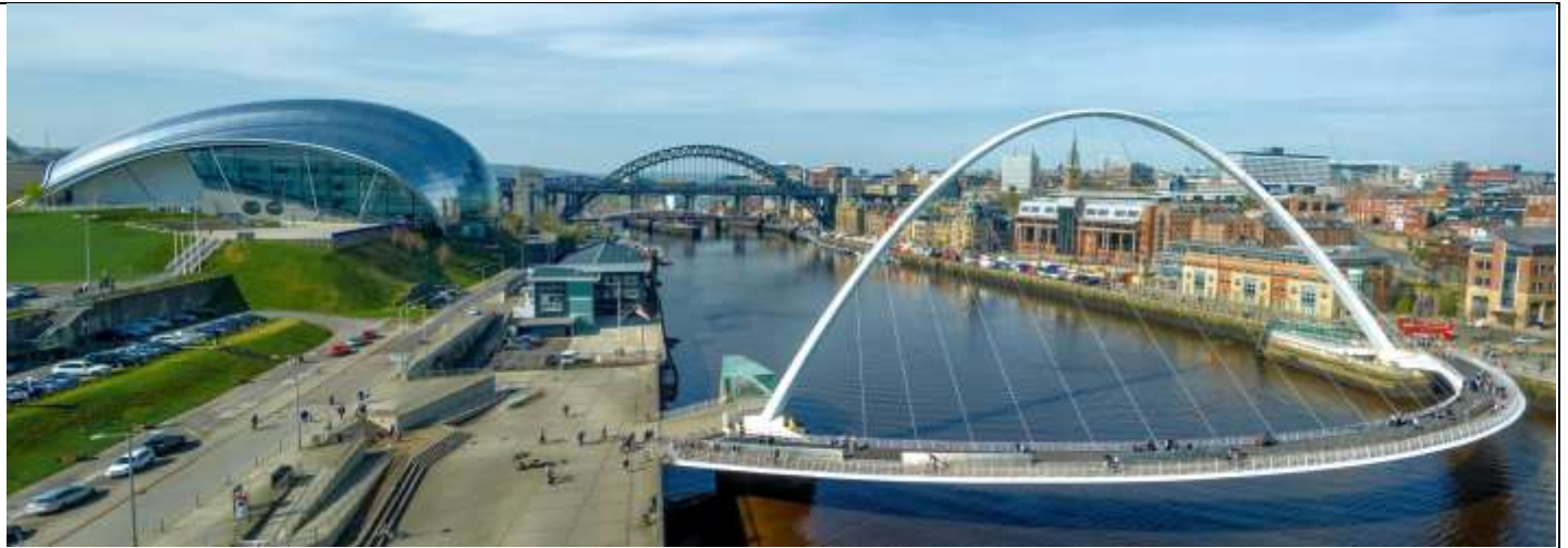
Tyne Bridge สะพานข้ามแม่น้ำไทน์ ที่เป็นดั่งสัญลักษณ์ของเมืองนิวคาสเซิล