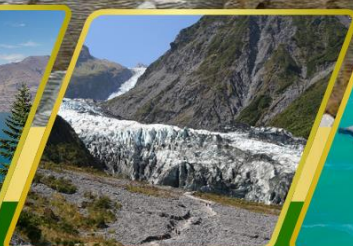
ธารน้ำแข็ง FOX GLACIER