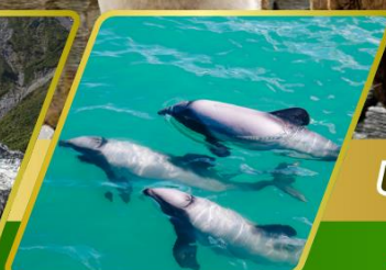
ส่องเรือชมโลมา อ่าวอาคารัว