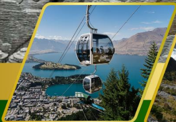
นั่งกระเช้าคอนโดล่า รับประทานอาหาร บนยอดเขานิวบ์ฟัด