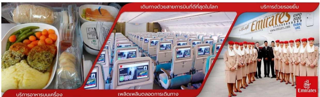
บริการอาหารบนเครื่อง

23.30 น. คณะพร้อมกันที่ สนามบินสุวรรณภูมิ ชั้น 4 บริเวณเคาน์เตอร์ T สายการบินเอมิเรตส์ EMIRATES AIRLINE (EK) โดยมีเจ้าหน้าที่ของทางบริษัทฯ คอยต้อนรับ และอำนวยความสะดวกด้านเอกสาร ออกบัตรที่นั่งและโหลดสัมภาระในการเดินทาง