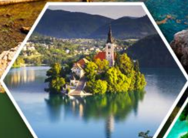
ทะเลสาบเบลล