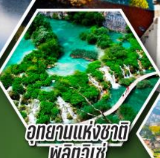
อุทยานแห่งชาติ พลิตวิเซ