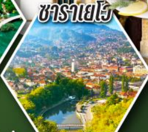
ซาราเยโว

• นั่งกระเช้าสู่ยอดเขาคุบรอฟนิค • ชิมหอยนางรมสดๆ เมืองสตอน