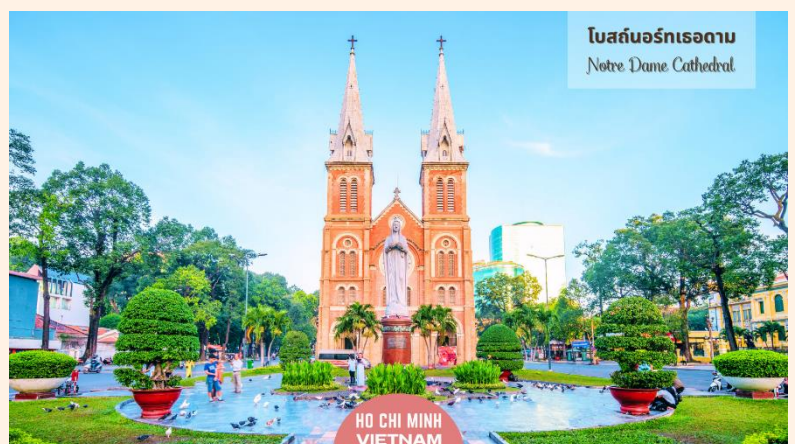
โบสถ์นอร์เทอดาม Notre Dame Cathedral

นำท่านถ่ายรูป มหาวิหารนอร์ทเทอดาม เป็นอัญมณีทางสถาปัตยกรรมอันงดงามที่มีความสำคัญทางประวัติศาสตร์และวัฒนธรรม วิหารแห่งนี้สร้างขึ้นในยุคอาณานิคมฝรั่งเศส และเป็นสัญลักษณ์ของมรดกอันมั่งคั่งและความศรัทธาอันยาวนานของชาวเมืองไซงอน วัสดุที่ใช้ก่อสร้างล้วนนำเข้ามาจากฝรั่งเศส เป็นการผสมผสานอิทธิพลระหว่างยุโรปและเวียดนามอย่างลงตัว ความสมบูรณ์ของโครงสร้างเป็นข้อพิสูจน์ถึงคุณภาพของวัสดุเหล่านี้ รวมถึงอิฐสีแดงที่แข็งแรงในส่วนหน้าของอาคารซึ่งมีความวิจิตรสวยงาม และยอดแหลมที่สูงตระหง่าน ภายในวิหารยังได้รับการออกแบบให้รองรับผู้คนได้ประมาณ 1,200 คน