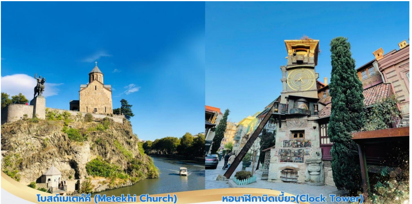
โบสถ์เมเตคคี (Metekhi Church)

ที่นี่มีชื่อเสียงในเรื่องบ่อน้ำร้อนกำมะถันธรรมชาติ จากนั้นนำท่านชม โบสถ์เมเตคคี (Metekhi Church) โบสถ์ที่มีประวัติศาสตร์อยู่คู่บ้านคูเมืองของทบิลีซี ตั้งอยู่บริเวณริมหน้าผาของแม่น้ำทวารี เป็นโบสถ์หนึ่งที่ตั้งอยู่ในบริเวณที่มีประชากรอาศัยอยู่ ซึ่งเป็นประเพณีโบราณที่มีมาแต่ก่อน กษัตริย์วาคตัง ที่ 1 แห่งจอร์กาซาลี ได้สร้างป้อมและโบสถ์ไว้ที่บริเวณนี้