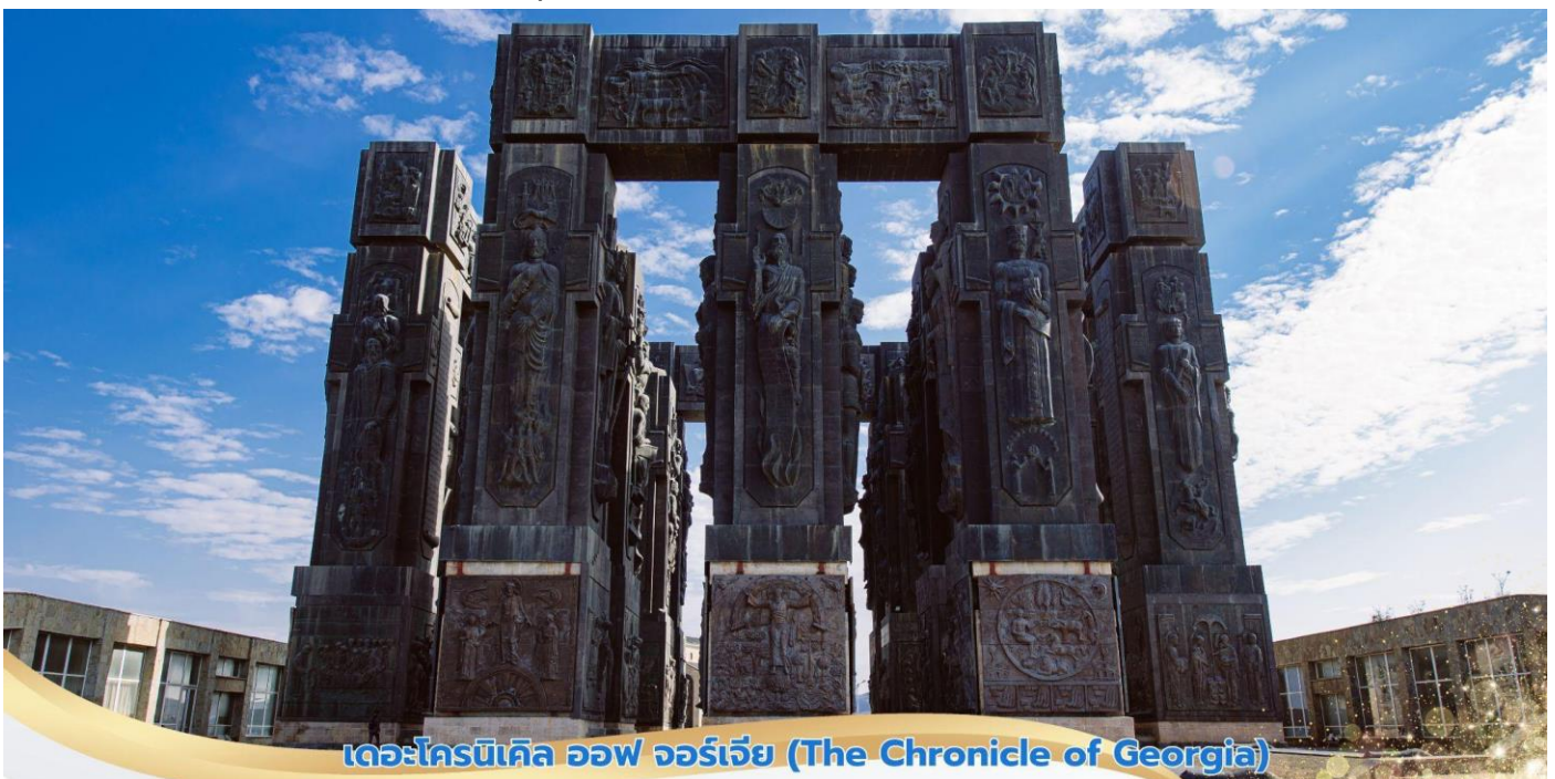
เดอะโครนิเคิล ออฟ จอร์เจีย (The Chronicle of Georgia)

นำท่านชม เดอะโครนิเคิล ออฟ จอร์เจีย (The Chronicle of Georgia) เสาหินสลักศิลปกรรมแบบเปอร์เซีย ขนาดใหญ่ จำนวน 16 ต้น ตั้งอยู่บนภูเขาสูงเป็นจุดชมวิวเมืองมูสูงที่สวยงาม สะท้อนถึงประวัติศาสตร์ของจอร์เจียและผู้ปกครองรวมถึงจากทางศาสนา เสาแต่ละต้นมีขนาดถึง 10 คนโอบ มีความสูงถึง 35 เมตร ซึ่งเสาแต่ละต้นได้บันทึกเรื่องราวทางประวัติศาสตร์ของประเทศจอร์เจียเอาไว้ในรูปแบบของงานจิตรกรรมปูนตํ่าอนุสาวรีย์เป็นที่รู้จักกันว่าเป็นอนุสรณ์สถานทางประวัติศาสตร์ของจอร์เจีย ถูกสร้างขึ้นโดยจิตรกรประติมากรชาวจอร์เจีย – รัสเซียและสถาปนิก ชื่อ Zurab Tsereteli อนุสรณ์ถูกสร้างขึ้นเพื่อเฉลิมฉลอง 3,000 ปี การได้มาซึ่งอำนาจอธิปไตยของชาวจอร์เจียและในวาระ 2,000 ปี แห่งการแผ่ขยายของศาสนาคริสต์นิกายออร์ทอดอกซ์ในจอร์เจีย