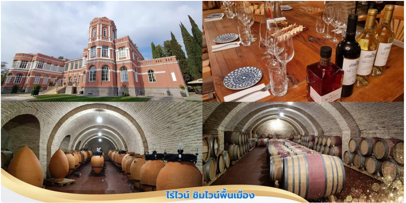
ไวน์ ซิมไวน์พื้นเมือง

นำท่านชม เดอะโครนิเคิล ออฟ จอร์เจีย (The Chronicle of Georgia) เสาหินสลักศิลปกรรมแบบเปอร์เซีย ขนาดใหญ่ จำนวน 16 ต้น ตั้งอยู่บนภูเขาสูงเป็นจุดชมวิวเมืองมูสูงที่สวยงาม สะท้อนถึงประวัติศาสตร์ของจอร์เจียและผู้ปกครองรวมถึงจากทางศาสนา เสาแต่ละต้นมีขนาดถึง 10 คนโอบ มีความสูงถึง 35 เมตร ซึ่งเสาแต่ละต้นได้บันทึกเรื่องราวทางประวัติศาสตร์ของประเทศจอร์เจียเอาไว้ในรูปแบบของงานจิตรกรรมปูนตํ่าอนุสาวรีย์เป็นที่รู้จักกันว่าเป็นอนุสรณ์สถานทางประวัติศาสตร์ของจอร์เจีย ถูกสร้างขึ้นโดยจิตรกรประติมากรชาวจอร์เจีย – รัสเซียและสถาปนิก ชื่อ Zurab Tsereteli อนุสรณ์ถูกสร้างขึ้นเพื่อเฉลิมฉลอง 3,000 ปี การได้มาซึ่งอำนาจอธิปไตยของชาวจอร์เจียและในวาระ 2,000 ปี แห่งการแผ่ขยายของศาสนาคริสต์นิกายออร์ทอดอกซ์ในจอร์เจีย