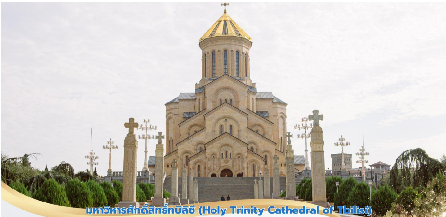
มหาวิหารศักดิ์สิทธิ์ทบิลีซี (Holy Trinity Cathedral of Tbilisi)

16.40 น. เดินทางถึง สนามบินทบิลีซี ประเทศจอร์เจีย (เวลาท้องถิ่นช้ากว่าไทย 3 ชั่วโมงกรุณาปรับนาฬิกาของท่านเป็นเวลาท้องถิ่นเพื่อความสะดวกต่อการนัดหมาย) จากนั้นนำท่าน มหาวิหารศักดิ์สิทธิ์ทบิลีซี (Holy Trinity Cathedral of Tbilisi) หรืออีกชื่อหนึ่งคือโบสถ์ Sameba เป็นโบสถ์หลักของคริสตจักรออร์ทอดอกซ์จอร์เจียอีกทั้งยังถูกจัดให้เป็นสิ่งก่อสร้างทางศาสนาที่มีขนาดใหญ่มากที่สุดในแถบอ่าวเปอร์เซีย และมีความสูงเป็นอันดับ 3 ของโลก