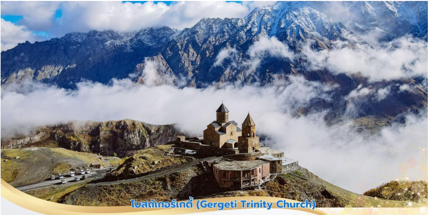
โบสถ์เกอร์เกตี้ (Gergeti Trinity Church)

ที่สุดแห่งหนึ่งของโลก โบสถ์เกอร์เกตี้แห่งนี้เป็นจุดหมายสำคัญ และยังเป็นจุดหมายปลายทางของนักท่องเที่ยวที่เดินทางมาเยือนประเทศจอร์เจีย