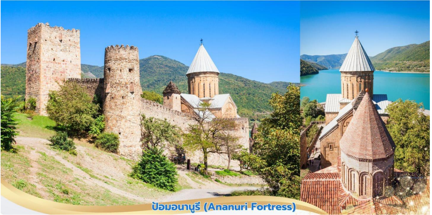
ป้อมอนูรี (Ananuri Fortress)

จากนั้นนำท่านเดินสู่เมือง Stepantsminda นำท่านแวะชม อนุสรณ์สถานรัสเซีย-จอร์เจีย (Russia-Georgia Friendship Monument) อนุสรณ์สถานหินโค้งวงแหวนขนาดใหญ่ สร้างขึ้นในปี 1983 เพื่อเฉลิมฉลองครบรอบ 200 ปี ของสนธิสัญญาจอร์เจียรัสเซีย (Treaty of Georgievski) และแสดงถึงความสัมพันธ์ระหว่างสหภาพโซเวียตกับจอร์เจีย