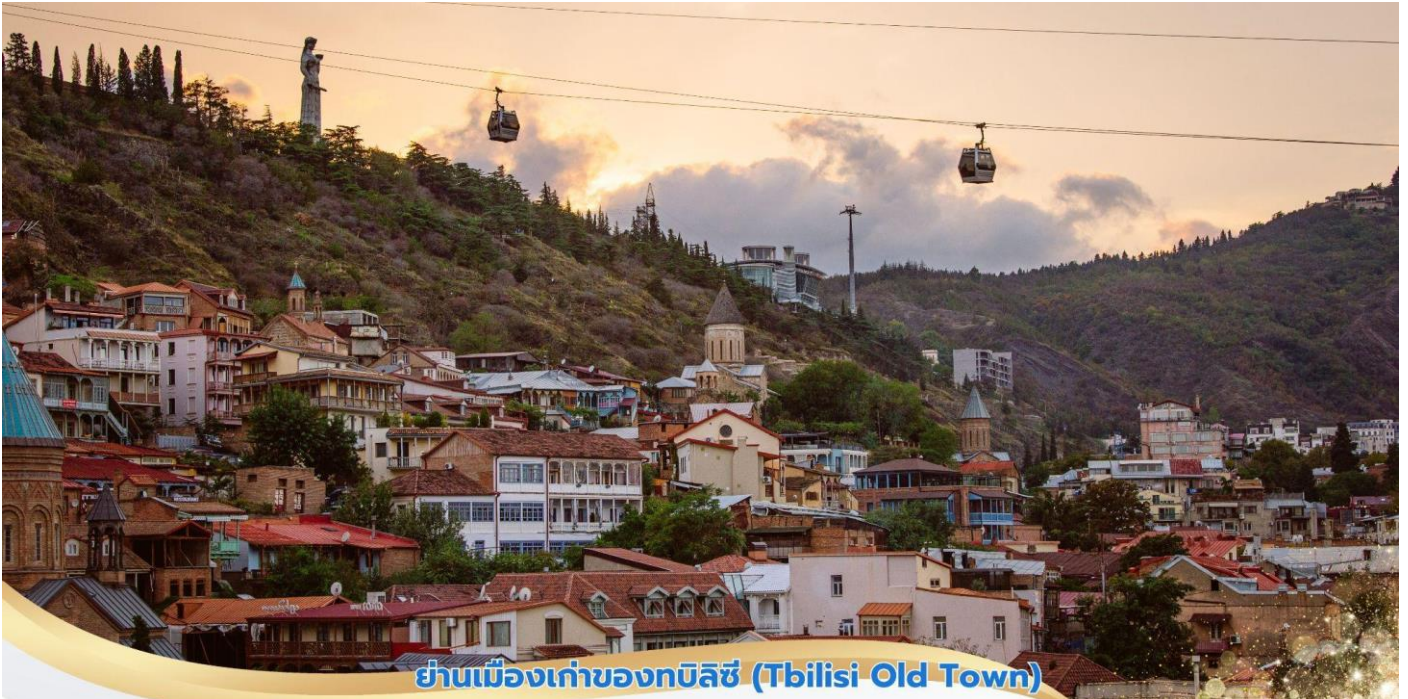
ย่านเมืองเก่าของทบิลีซี (Tbilisi Old Town)

นำท่านชม หอนาฬิกาบิดเบี้ยว(Clock Tower) เมื่อเข็มนาฬิกาไปชี้ที่เลข12 (XII) จะพบกับรูปปั้นนางฟ้า เปิดประตูออกมาทักทายผู้คนที่ระเบียง และใช้ค้อนคู่มือที่ระบงบอกเวลาอีกจุดไฮไลท์ ไม่ควรพลาด สำหรับการเดินเที่ยวในกรุงทบิลีซี จากนั้นนำท่านชมภายนอก โรงอาบน้ำแร่เก่าแก่ (Bath Houses)