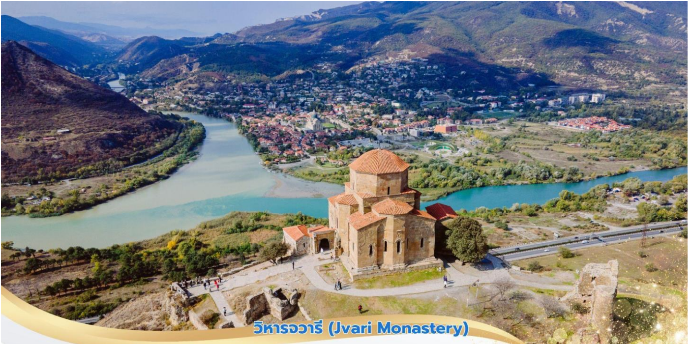
วิหารจวารี (Jvari Monastery)

นำท่านชม วิหารสเวติสเคอเวรี (Svetitkhoveli Cathedral) ซึ่งคำว่า Sveti หมายถึง "เสา" และ Tskhoveli หมายถึง "ชีวิต" โดยความหมายรวมกัน หมายถึงวิหารเสาที่มีชีวิต โบสถ์แห่งนี้ถือเป็นศูนย์กลางทางศาสนาที่ศักดิ์สิทธิ์ที่สุดของจอร์เจีย สร้างขึ้นโดยสถาปนิกชาวจอร์เจีย มีขนาดใหญ่เป็นอันดับสองของประเทศ อีกทั้งยังเป็นศูนย์กลางที่ทำให้ชาวจอร์เจียเปลี่ยนความเชื่อและหันมานับถือศาสนาคริสต์