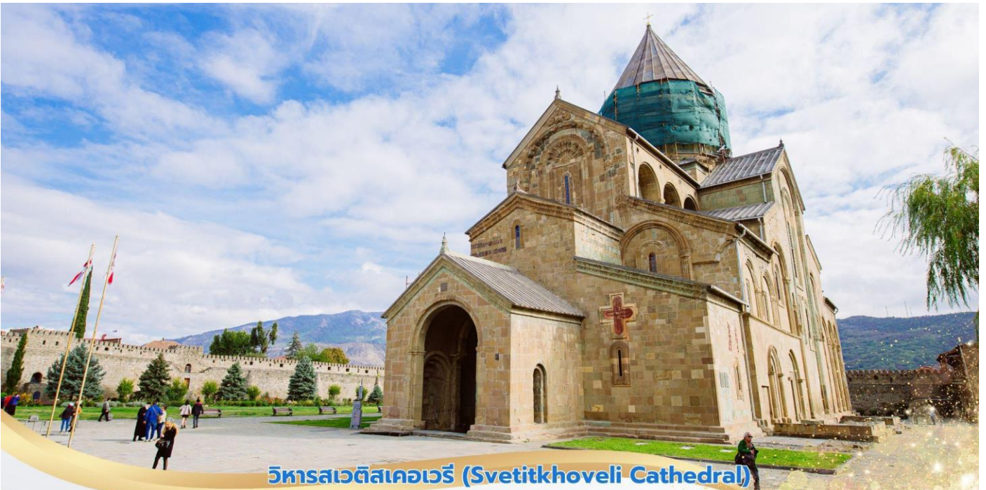
วิหารสเวติสเคอเวรี (Svetitkhoveli Cathedral)

นำท่านชม วิหารสเวติสเคอเวรี (Svetitkhoveli Cathedral) ซึ่งคำว่า Sveti หมายถึง "เสา" และ Tskhoveli หมายถึง "ชีวิต" โดยความหมายรวมกัน หมายถึงวิหารเสาที่มีชีวิต โบสถ์แห่งนี้ถือเป็นศูนย์กลางทางศาสนาที่ศักดิ์สิทธิ์ที่สุดของจอร์เจีย สร้างขึ้นโดยสถาปนิกชาวจอร์เจีย มีขนาดใหญ่เป็นอันดับสองของประเทศ อีกทั้งยังเป็นศูนย์กลางที่ทำให้ชาวจอร์เจียเปลี่ยนความเชื่อและหันมานับถือศาสนาคริสต์