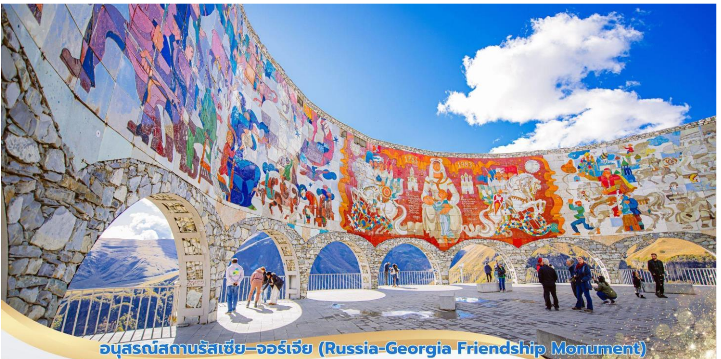
อนุสรณ์สถานรัสเซีย-จอร์เจีย (Russia-Georgia Friendship Monument)

จากนั้นนำท่านเดินสู่เมือง Stepantsminda จากนั้นนำท่านเปลี่ยนเป็น รถออฟโรด (4X4 ขับเคลื่อน 4 ล้อ) นั่งคันละไม่เกิน 6 ท่าน ขึ้นสู่ยอดเขาคาสเบก ใช้เวลาเดินทางประมาณ 15 นาที เมื่อเดินทางไปยังบริเวณจุดจอดรถ ภาพเบื้องหน้าของก็คือ โบสถ์เทอริเทตี (Gergeti Trinity Church) โบสถ์เก่าแก่ที่สร้างขึ้นในยุคกลาง ด้วยความศรัทธาอย่างเต็มเปี่ยม อายุกว่า 600 ปี ตั้งอยู่บนความสูงจากระดับน้ำทะเล 2,170 เมตร ผู้มาเยือนต่างขนานนามว่า โบสถ์เทอริเทตี เป็นหนึ่งในโบสถ์ที่สวยงาม