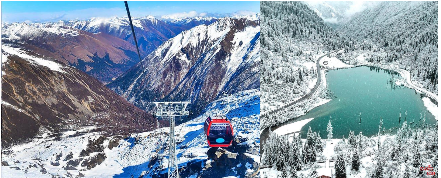
อาหารเย็น (มื้อที่ 10)

มีไฮไลต์ท่องเที่ยวเด่นๆ เช่น ภูเขาหิมะการ์เซีย (Mt. Garze Glacier) เป็นหนึ่งในจุดเด่นที่น่าสนใจที่สุด ด้วยความสูงกว่า 4,860 เมตรเหนือระดับน้ำทะเล ภูเขานี้ปกคลุมไปด้วยหิมะขาวตลอดทั้งปี ทะเลสาบหยก (Jade Lake) เป็นอีกหนึ่งจุดที่น่าทึ่ง น้ำในทะเลสาบมีสีเขียวมรกตที่สดใสและเจียบสงบ ล้อมรอบด้วยภูเขาและป่าไม้ที่อุดมสมบูรณ์ ธารน้ำแข็ง (Glacier Valley) ธารน้ำแข็งเหล่านี้มีอายุยาวนานและอยู่ในสภาพที่สมบูรณ์มาก และ กระเช้าลอยฟ้าที่ยาวที่สุดในโลก ด้วยระยะทางกว่า 5,000 เมตร เราสามารถนั่งกระเช้าเพื่อขึ้นไปบนยอดเขา สามารถมองเห็นภูเขาน้ำแข็ง 3 ลูกซึ่งเชื่อว่าเป็น "สันหลังมังกร" เป็นภาพที่งดงามราวกับแดนสวรรค์เลยทีเดียว