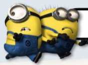
ZONE 5 : THE LOST WORLD