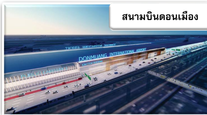
สนามบินดอนเมือง

เวลา 22.00 น. พร้อมกันที่ สนามบินดอนเมือง อาคารผู้โดยสารขาออกระหว่างประเทศเคาน์เตอร์ สายการบิน ไทยแอร์เอเชีย เอ็กซ์ เจ้าหน้าที่คอยให้การต้อนรับ ดูแลด้านเอกสาร เช็คอิน และสัมภาระในการเดินทาง