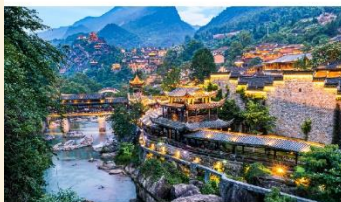
หุบเขาเทวดาฉางเซียนกู่