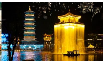
ล่องเรืออู่หนี่โจว