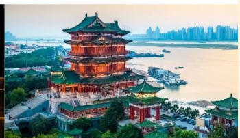
หอเจ๋งหวัง

*ทางบริษัทฯ ขอสงวนสิทธิ์ในการสลับโปรแกรมทัวร์ตามความเหมาะสมขึ้นอยู่กับสถานการณ์หน้างาน โดยคำนึงถึงผลประโยชน์ของลูกค้าเป็นสำคัญ