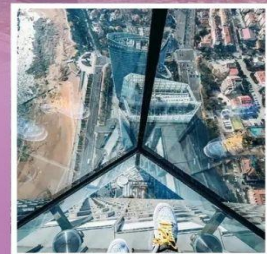
QINGDAO HAITIAN CENTER