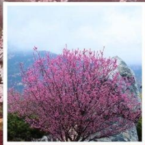
ชมดอกท้อเขาไท่ซาน