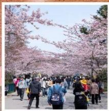
ซากุระจงซาน