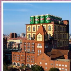
โรงงานเบียร์ซิงเต่า