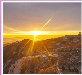
ยอดเขาอวิ้อว