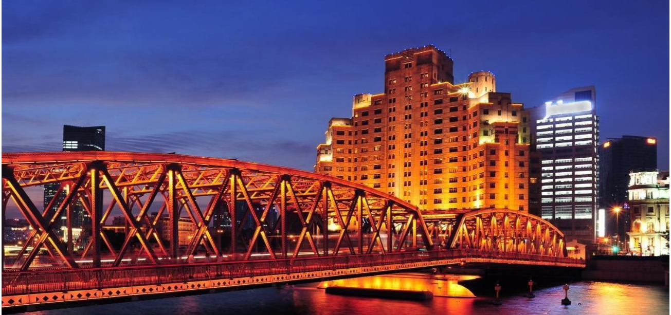
📍 พักที่ GRAND METROPARK HOTEL หรือเทียบเท่าระดับ 5 💎💎💎💎💎

วันที่สาม Music gate x Manner Coffee (ไม่รวมค่าเครื่องดื่ม) – Rockbund Shamei Building – Tian An 1,000 Trees Square – ลักซ์ซัวรี แลนด์มาร์ก จางหยวน – ถนนคนเดินหอยไ้ SONGMOUNT – ถนนอันฟู (13DE MARZO) – ย่านซินเทียนตี้