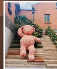
ลักซ์ชัวร์ แลนด์มาร์ก จางหยวน