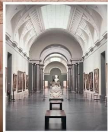
PUDONG ART MUSEUM