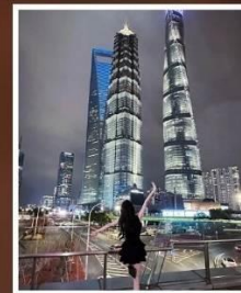
SKYWALK ลู่เจียจู่ย

รับฟรี! ประกันสุขภาพ และ อุบัติเหตุ 2 ล้านบาท