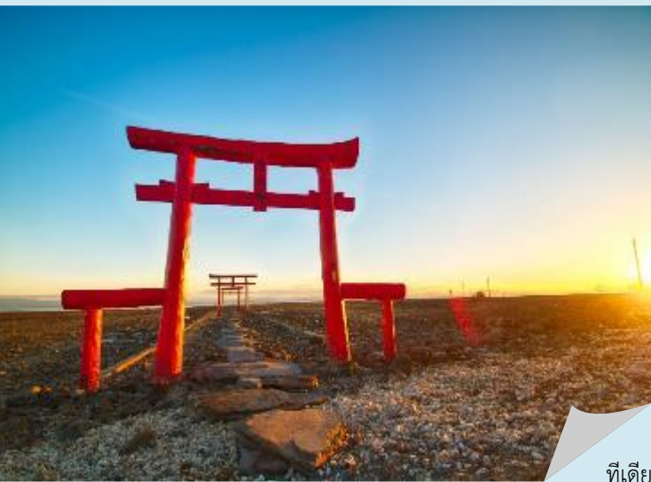
ที่เดียว

เที่ยง บริการอาหารกลางวัน ณ ภัตตาคาร พิเศษ!! บริการท่านด้วยบุฟเฟ่ต์ซาบุมิ