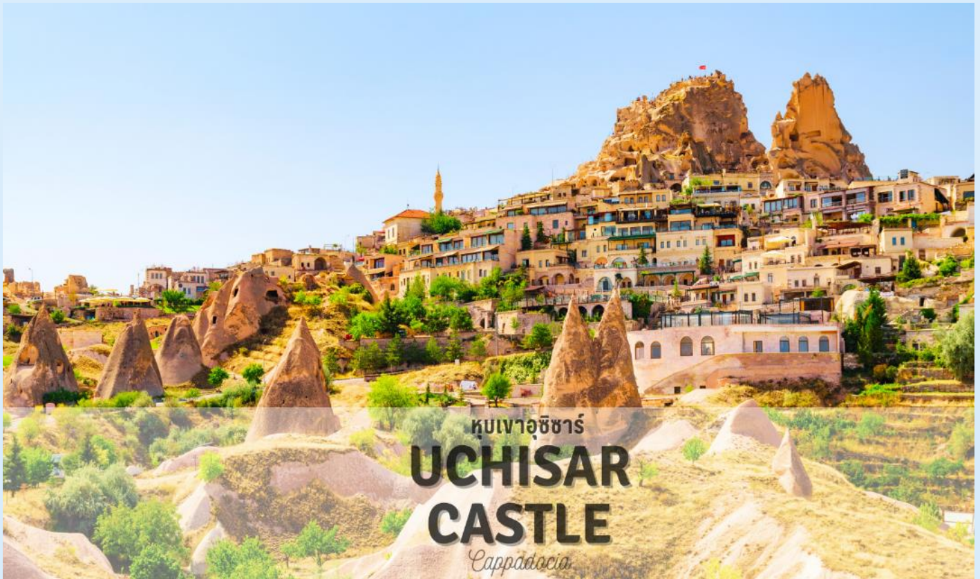
หุบเขาอุชิซาร์ UCHISAR CASTLE Cappadocia

แวะถ่ายรูป หุบเขาอุชิซาร์ (UCHISAR VALLEY) หุบเขาค่ายจอมปลวกขนาดใหญ่ ใช้เป็นที่อยู่อาศัย ซึ่งหุบเขาดังกล่าวมีรูพรุน มีรอยเจาะ รอยซุด อันเกิดจากฝีมือมนุษย์ไปเกือบทั่วทั้งภูเขา เพื่อเอาไว้เป็นที่อยู่อาศัย