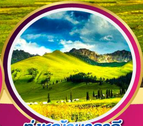
ทุ่งหญ้านาลาดี้