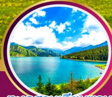
ทะเลสาบเทียนชาน