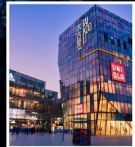
ย่านซานหลี่ถุน