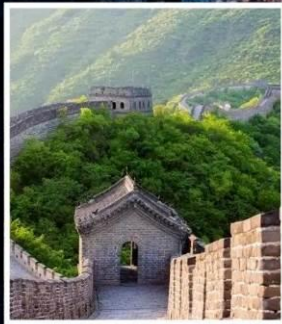
กำแพงเมืองจีน มู่เทียนยวี