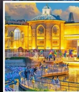
ห้าง SOLANA CENTER