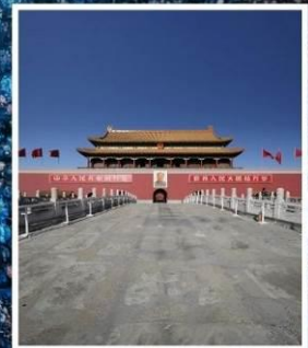
จัตุรัส เทียนอันเหมิน