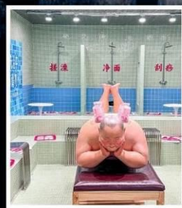
คาเฟ่ย้อนยุคเหอผิง