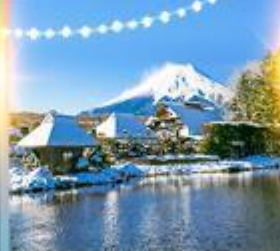
โอชิโนะ ฮักโค