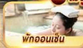
พักออนเซ็น