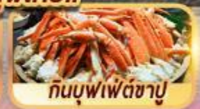
กินบุฟเฟ่ต์ซาปู