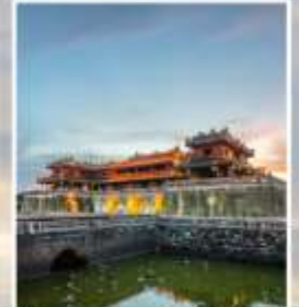
เว้ พระราชวังโตไน่ย์