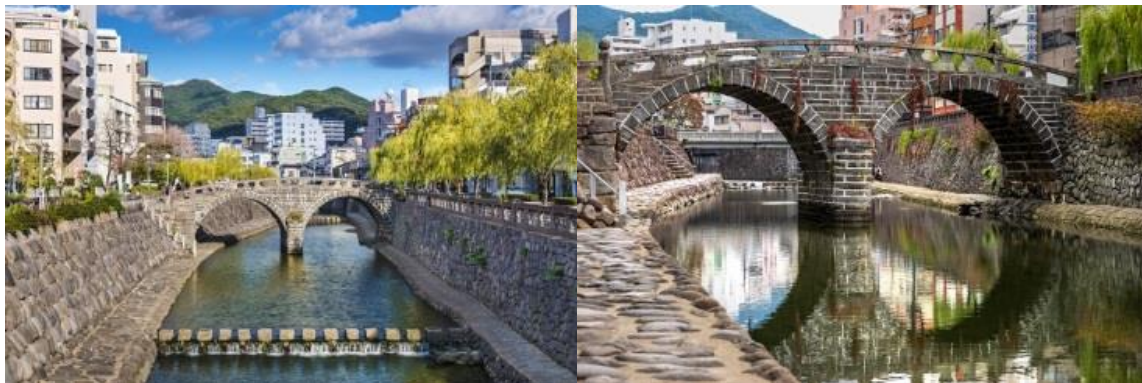
สะพานเมกานะบาชิ (Meganebashi Bridge)

นางาซากิ (Nagasaki) เป็นเมืองที่ตั้งอยู่ทางตะวันตกของเกาะคิวชู ประเทศญี่ปุ่น เมืองนี้เป็นที่รู้จักจากประวัติศาสตร์อันยาวนานและวัฒนธรรมที่หลากหลาย เมืองนี้เป็นที่รู้จักจากชายหาดที่สวยงาม อาหารทะเลสด และสถานที่ท่องเที่ยวทางประวัติศาสตร์และวัฒนธรรมมากมาย