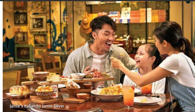
Jamie's Italian by Jamie Oliver