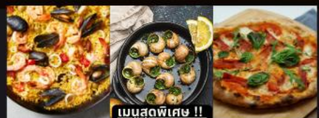
เมนูสุดพิเศษ !!