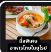
มือพิเศษ อาหารไทยในยุโรป