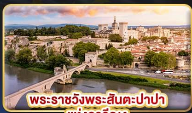
พระราชวังพระสันตะปาปา แห่งอาวีญง