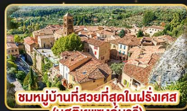
ชมหมู่บ้านที่สวยงามที่สุดในฝรั่งเศส (บูสตีเยแซงก์มารี)