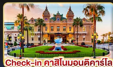
Check-in คาสีโนมอนติคาร์โล